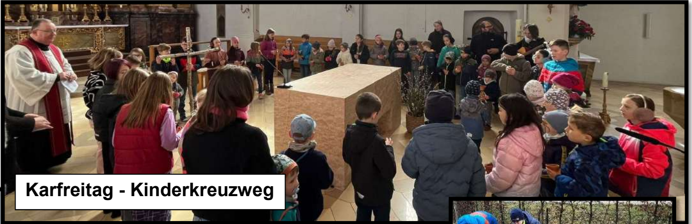
Karfreitag - Kinderkreuzweg